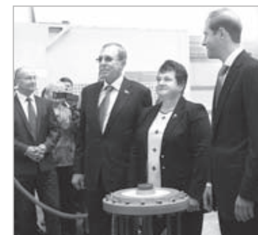
Губернатор Светлана Орлова, министр промышленности и торговли РФ Денис Мантуров (справа) и генеральный директор завода «Гусар» Александр Березкин на церемонии открытия предприятия.